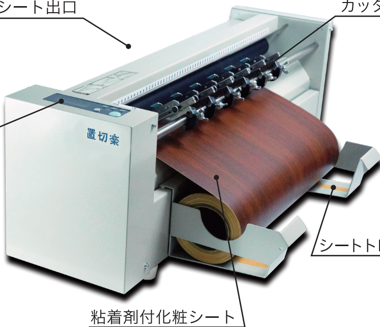
粘着剤付化粧シート